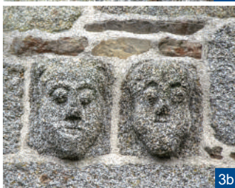
3. La maison des pendus / 3a. Détail d'une des pierres sculptées avec un visage tirant la langue / 3b. Détail d'une pierre sculptée

Au XII e siècle, les moines de l'abbaye de Rillé de Fougères réunissent les deux édifices préromans en une seule et vaste église. Ils ne sont distincts que de quelques marches et par des grilles en fer forgé.