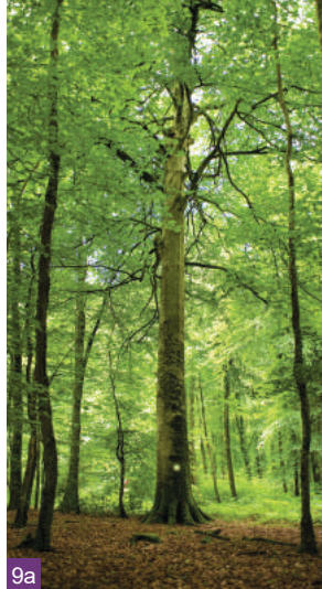
8. Les « remparts », les hauts murs de la rue des douves / 9. L'auge des sabotiers / 9a. La forêt de Villercartier

XVII e siècle par Gilles Ruellan, personnage étonnant que son ascension fulgurante mit à la tête d'importantes seigneuries.