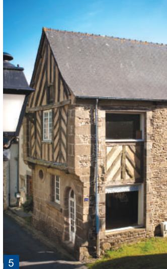
4. La tour du manoir du Colombier / 5. Maison à pan de bois