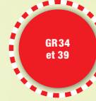
GR 34 et 39