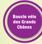
Boucle vélo des Grands Chênes