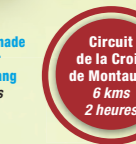
Circuit de la Croix de Montaugé 6 kms 2 heures Balisage à suivre : Rond rouge