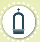
Circuit des petits monuments 9,5 kms 2h45mn Balisage à suivre : Rond blanc