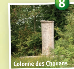
Colonne des Chouans