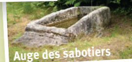
Auge des sabotiers