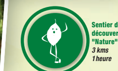
Sentier de découverte "Nature" 3 kms 1 heure