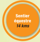
Sentier équestre 14 kms