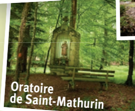
Oratoire de Saint-Mathurin