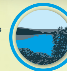
Promenade du tour de l'étang 2,8 kms 1 heure