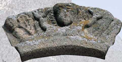
Détail du portail de l'église de Tremblay.

Juchée sur une colline, l'église Saint-Martin (XV e -XVII e siècles), au Tiercent, a toujours son petit cimetière, blotti en son enclos. L'église Saint-Martin de Tremblay (XI e -XIX e siècles) fut agrandie au XVIII e : sur le pignon, la taille et la teinte des pierres montrent clairement la nature des travaux. Du clocher massif de Saint-André (Antrain, XII e -XVIII e siècles) à la flèche d'ardoises élancée de Notre-Dame (Chauvigné, XI e -XIX e siècles) il y a tout un monde que la route traverse, pour le plus grand plaisir des amateurs de vieilles pierres. Les moulins, tels ceux de Quincampoix à Rimou et de Guémain à Vieux-Vy-sur-Couesnon, utilisaient jadis la force motrice de la rivière pour la papeterie ou la meunerie. Des maisons pleines de charme s'élèvent le long de la route, comme aux hameaux de Montéchar, Brimenel ou au bourg de Saint-Christophe-de-Valains. Ici et là, on découvre