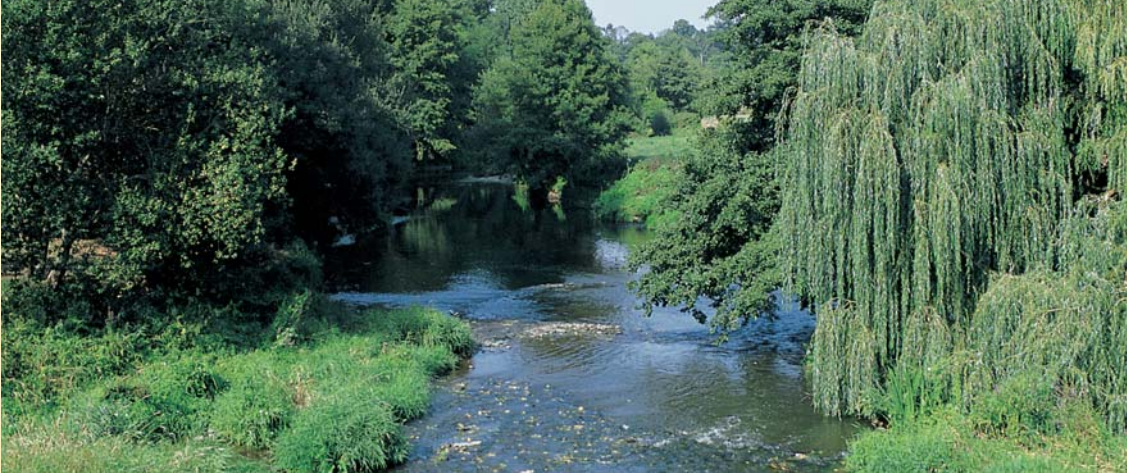
Le Couesnon à Antrain.

Juchée sur une colline, l'église Saint-Martin (XV e -XVII e siècles), au Tiercent, a toujours son petit cimetière, blotti en son enclos. L'église Saint-Martin de Tremblay (XI e -XIX e siècles) fut agrandie au XVIII e : sur le pignon, la taille et la teinte des pierres montrent clairement la nature des travaux. Du clocher massif de Saint-André (Antrain, XII e -XVIII e siècles) à la flèche d'ardoises élancée de Notre-Dame (Chauvigné, XI e -XIX e siècles) il y a tout un monde que la route traverse, pour le plus grand plaisir des amateurs de vieilles pierres. Les moulins, tels ceux de Quincampoix à Rimou et de Guémain à Vieux-Vy-sur-Couesnon, utilisaient jadis la force motrice de la rivière pour la papeterie ou la meunerie. Des maisons pleines de charme s'élèvent le long de la route, comme aux hameaux de Montéchar, Brimenel ou au bourg de Saint-Christophe-de-Valains. Ici et là, on découvre