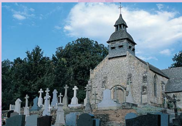
L'église Saint-Martin, au Tiercent et son enclos.

Pays du granit, qui parfois affleure au milieu d'un champ, la Vallée du Couesnon présente une belle variété architecturale comme en témoignent les nombreuses églises, chacune dotée d'une personnalité unique.