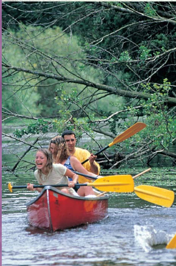
Canoë sur le Couesnon.

La pierre abrite les hommes mais les relie aussi : le pont d'Antrain, aux trois arches dissemblables, compose une halte plaisante sur les rives du Couesnon ; vous le retrouverez symbolisé sur les panneaux de signalisation du circuit!