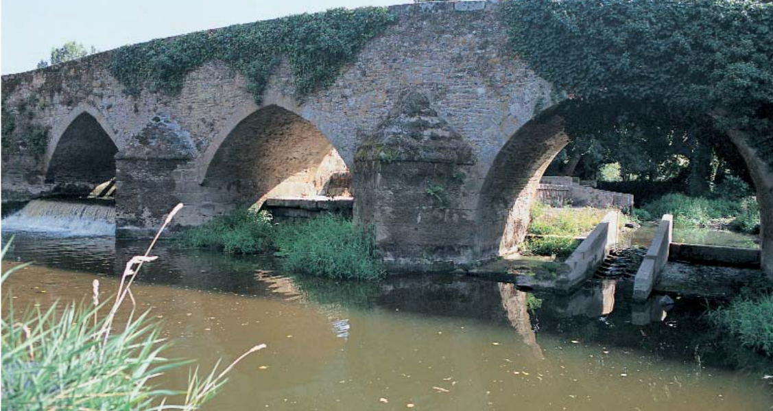
Le pont d'Antrain, aux trois arches dissemblables.

À Vieux-Vy-sur-Couesnon, elle s'élève pour embrasser un impressionnant point de vue : loin en contrebas court la rivière. Tour à tour dissimulé et révélé, vif et assoupi, le Couesnon est sans aucun doute la vedette du circuit. Il suffit parfois de traverser un pont pour comprendre son tempérament : d'un côté à l'autre de l'édifice il aura changé d'humeur, se parant soudain d'écume. À Saint-Ouen-des-Alleux, le cours d'eau se fraie une route dans une vallée encaissée ; les arbres se penchent alors au-dessus de la rivière, comme une politesse faite au promeneur.