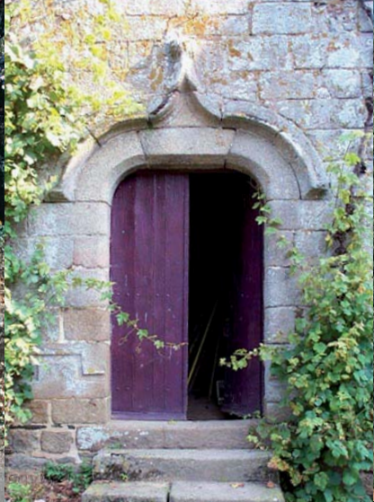
Porte en anse de panier.